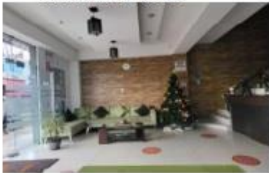
INGRESO AL HOTEL